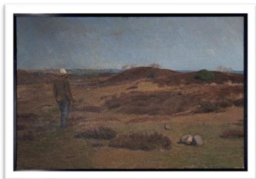
Kunstneren ved Ørkesholm